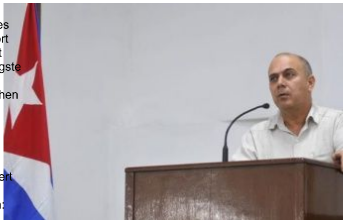
Dr. Roberto Morales Ojeda, Minister für öffentliche Gesundheit von Kuba

Dr. Roberto Morales Ojeda, Mitglied des Politbüros und Minister für öffentliche Gesundheit, stellte außerdem fest, dass die Müttersterblichkeitsrate von 42,6 auf 38 Todesfälle pro 100.000 reduziert wurde. Dazu bedankte er sich für "die Motivation, Zuverlässigkeit und Wachsamkeit" der Arbeitnehmer im Gesundheitssektor und unterstrich: "Hinter jeder Zahl und Statistik sind Leben gerettet, die Lebensqualität, Glück und Zufriedenheit unseres Volkes verbessert worden, und ist die Verpflichtung enthalten, wie viel mehr wir jeden Tag tun können."